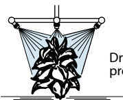
Drei Düsen pro Reihe

Weitere technische Informationen und nützliche Formeln s.S. 136–157.