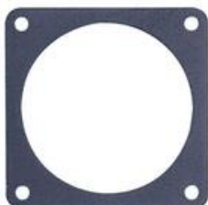
RIV 150 Controflangia in acciaio