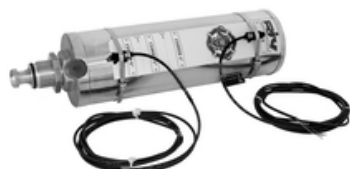
RIV 161 Cilindro doppio effetto pneumatico in alluminio con sistema PPS e sensori di posizione serie Perla / Diamante / Centurion / Vulcano