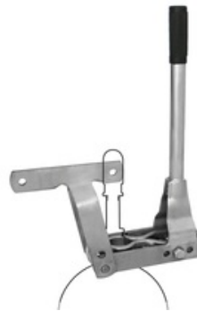
RIV 153 Hebelgarnitur mit Öffnungssperrvorrichtung Perla Serie