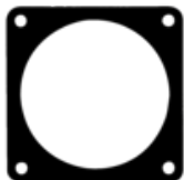
RIV 157 EPDM-Flachdichtung für Agrarstandardflansche