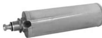
RIV 160 Doppelwirkender pneumatischer Zylinder aus aluminium mit PPS-System Perla / Diamante / Centurion / Vulcano Serie