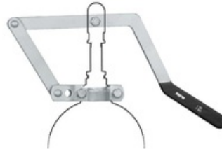
RIV 151 Hebelgarnitur mit Öffnungssperrvorrichtung Perla / Diamante / Centurion / Vulcano Serie