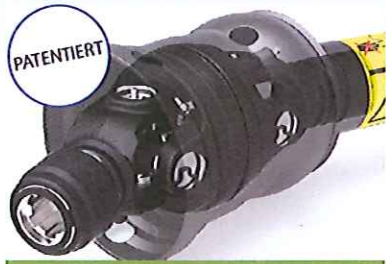
Kompakte und gelenkige Schutzvorrichtung bis zu 80°